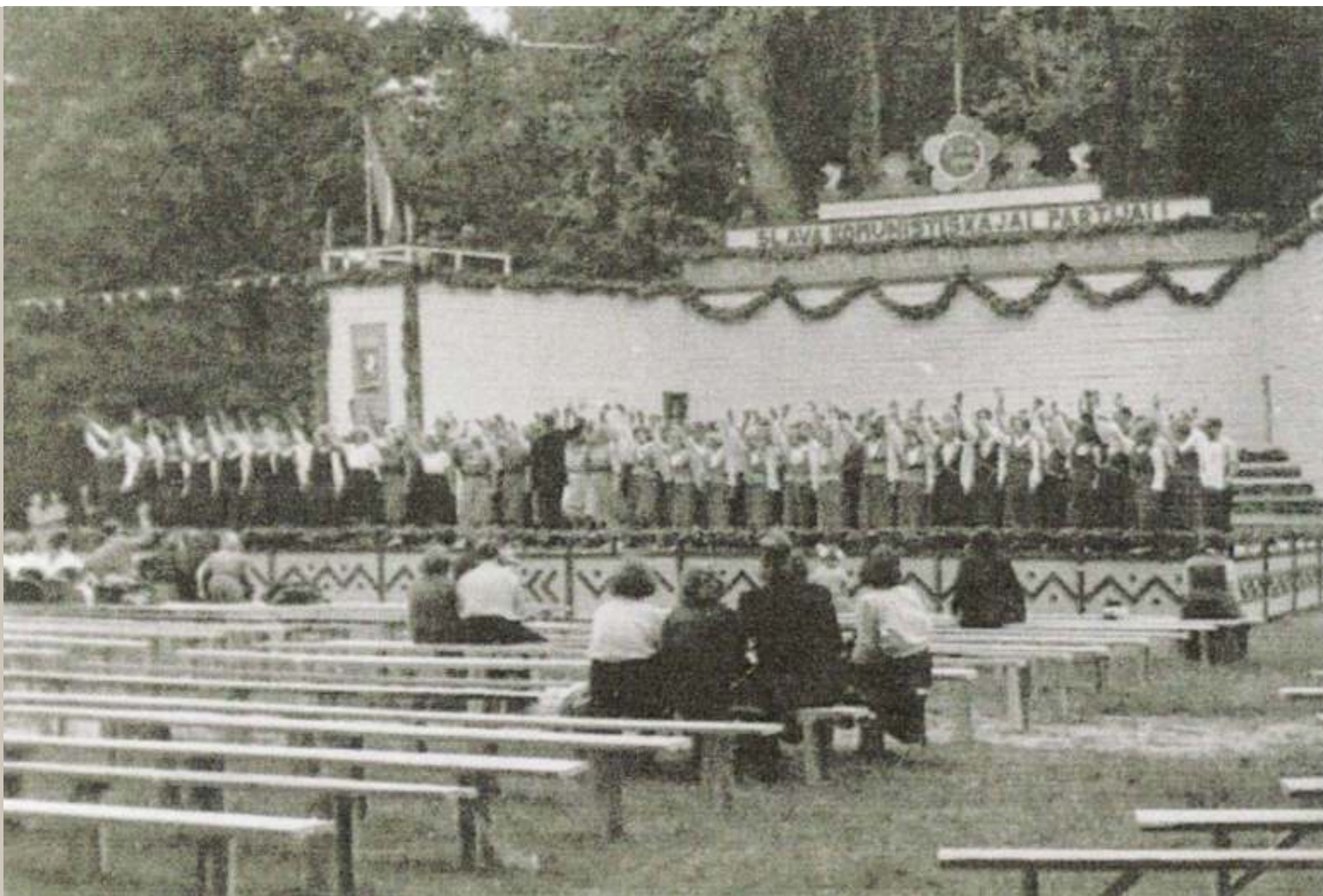
1950. gada vasarā uzceltās Elejas parka estrādes kopskats. 1957. gada foto

Padomju laikā pēc Otrā pasaules kara Eleja kļuva par pastāvīgu vietu, kur rīkot kopīgus dziesmusvētkus mūsdienu Jelgavas novada pagastiem. Elejai jau kopš starpkaru Latvijas laika sākumiem ir bijis kāds “trumpis” jeb priekšrocība šādu svētku rīkošanā – skaistais muižas parks, kuram līdzīga nav nekur apkaimē un kurā varēja atrast arī vietu estrādei. Dziesmusvētki Elejā pirms Otrā pasaules kara norisa nelielās pagaidu estrādēs, kā jau tas bija ierasts daudzviet Latvijas laukos. Bet piecus gadus pēc kara – 1950. gada vasarā – tapa lielāka un pirmā pastāvīgā estrāde.