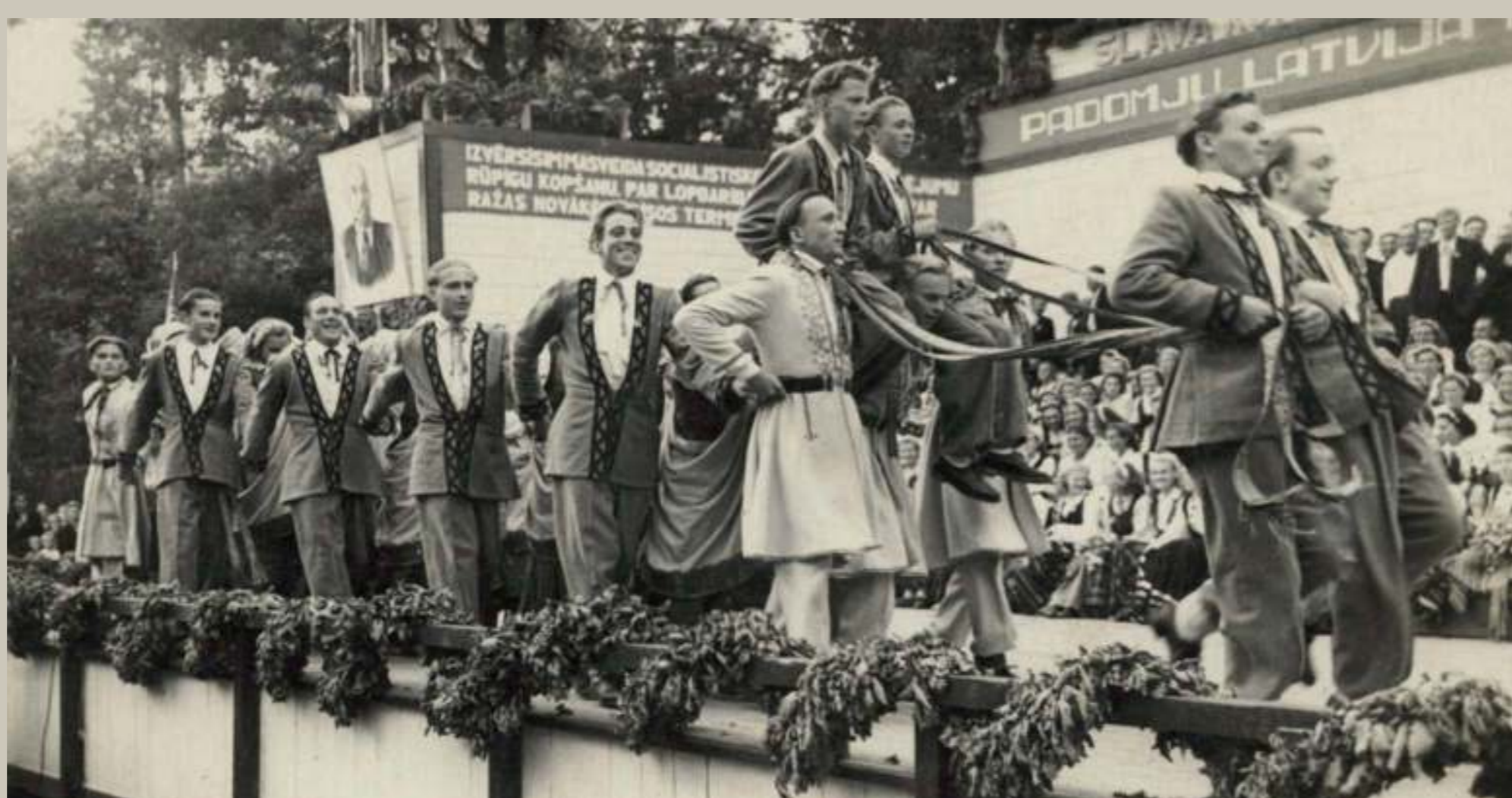
1954. gada dziesmusvētkos koncerta izskaņas daļa bijusi grandioza