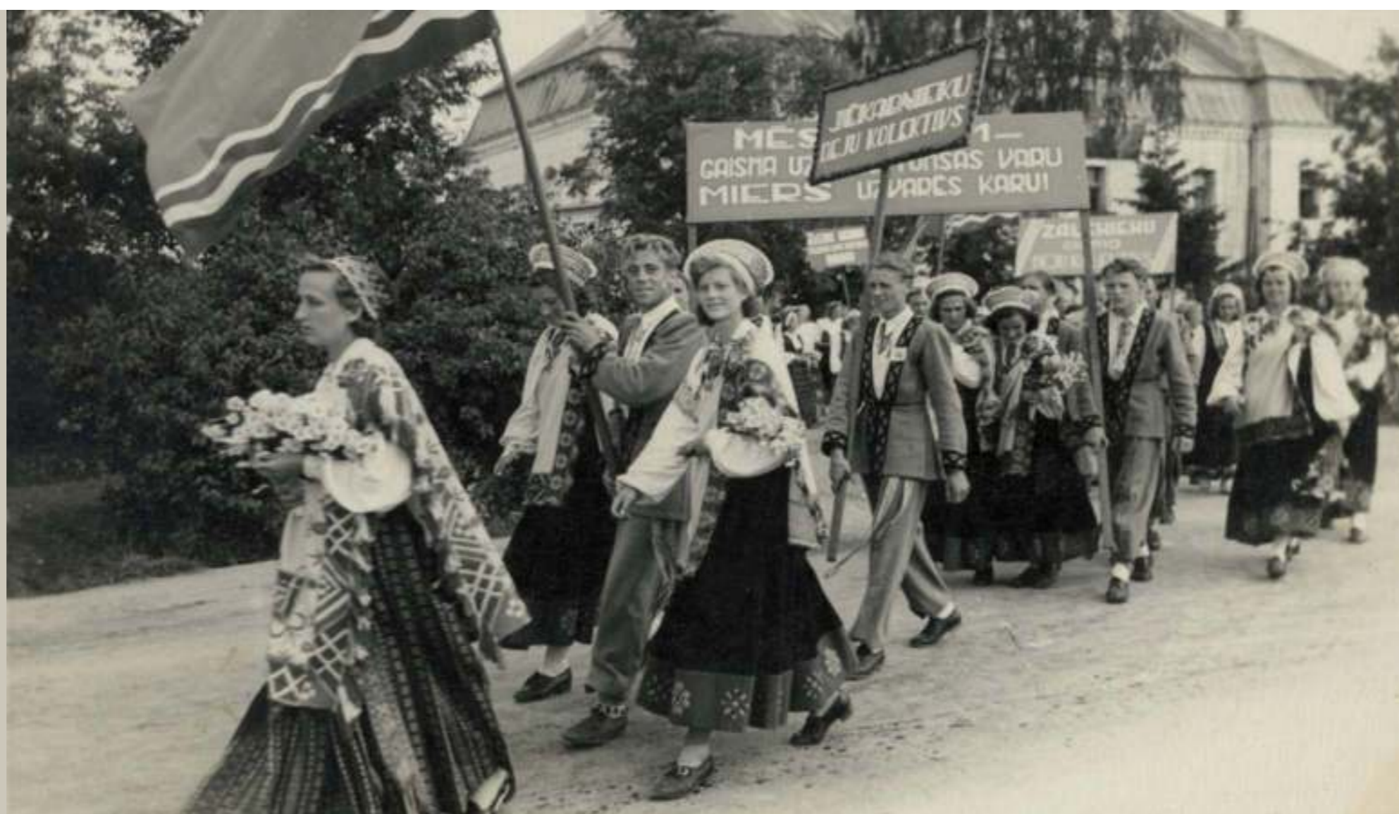
Domājams, 1954. gads. Gājienā – gan kolektīvu nosaukumi, gan politiski saukļi un simbolika