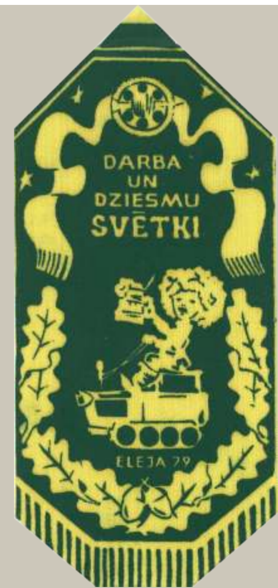
Piemiņai no svētkiem tapa vimpeli