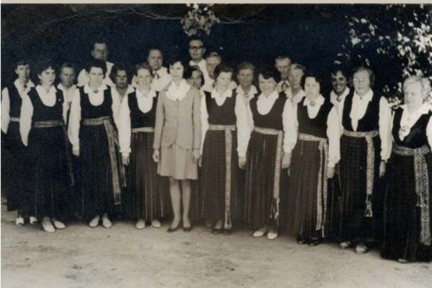
Viens no kolektīviem, kas Jelgavas rajona dziesmusvētkos piedalījies patiešām daudzus gadus, ir Lielplatones ciema koris. Attēls no 1968. gada