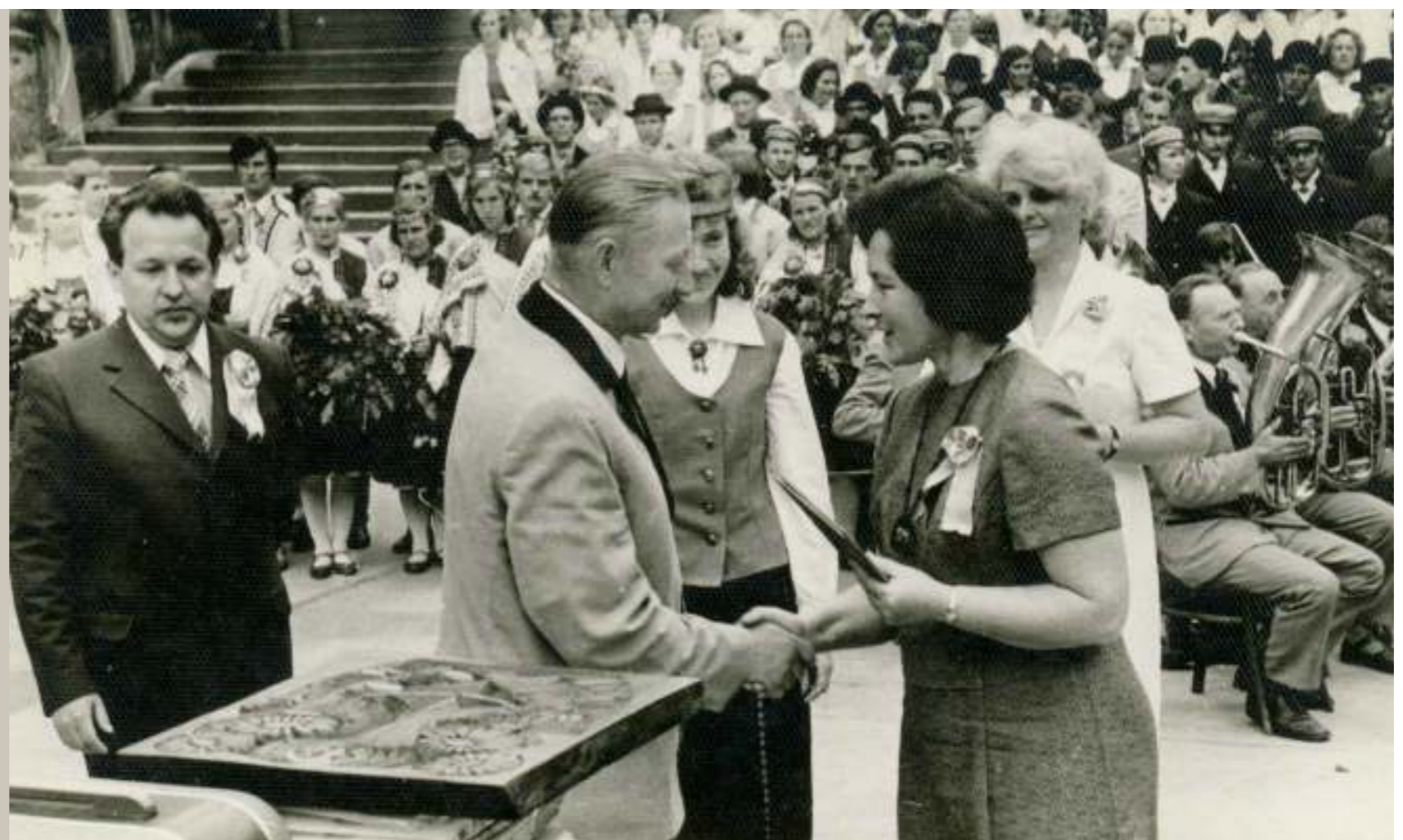
Ilggadēju koristu godināšana koncerta izskaņā