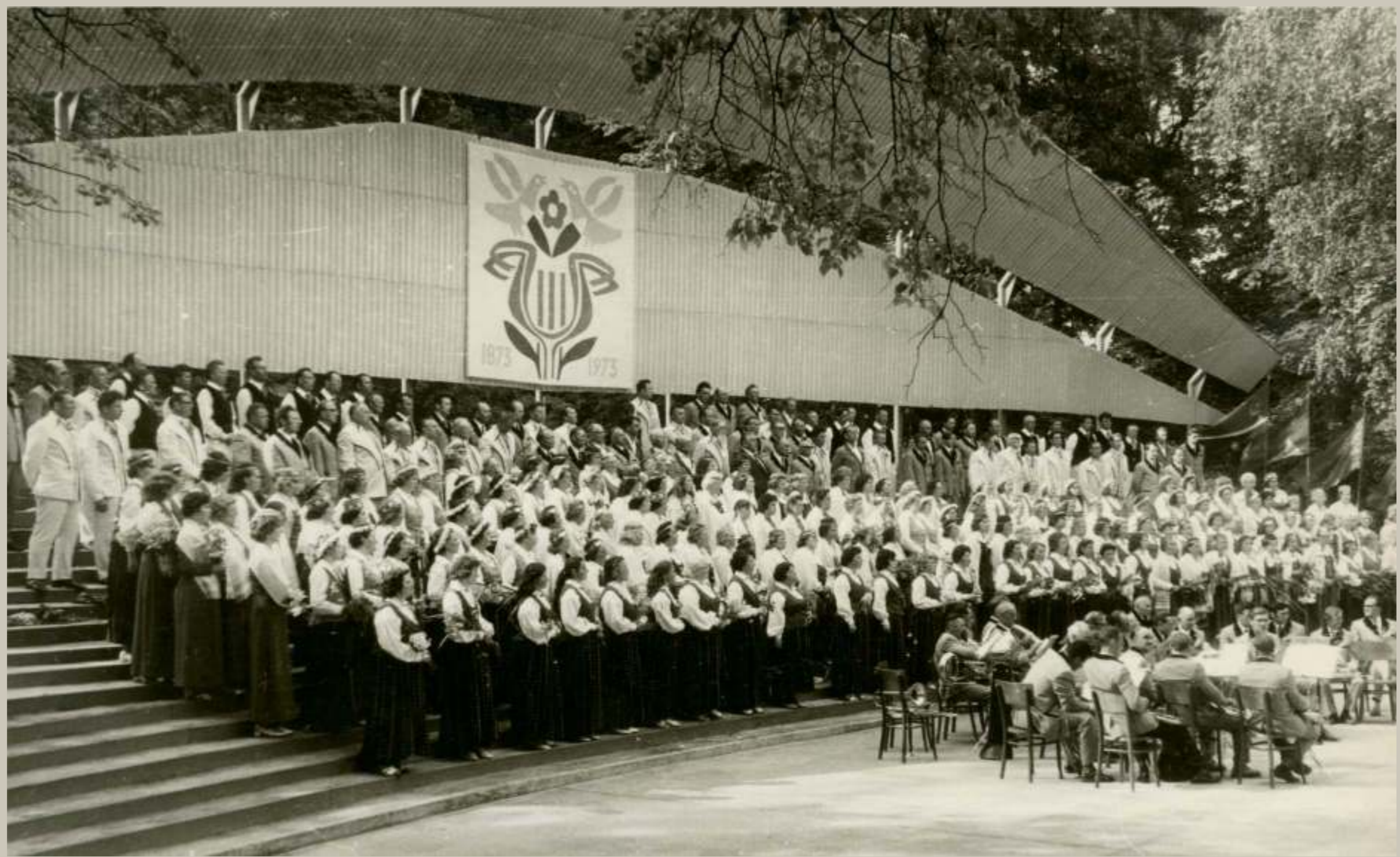
1973. gads. Estrādē izvietojies koris un pūtēju orķestris