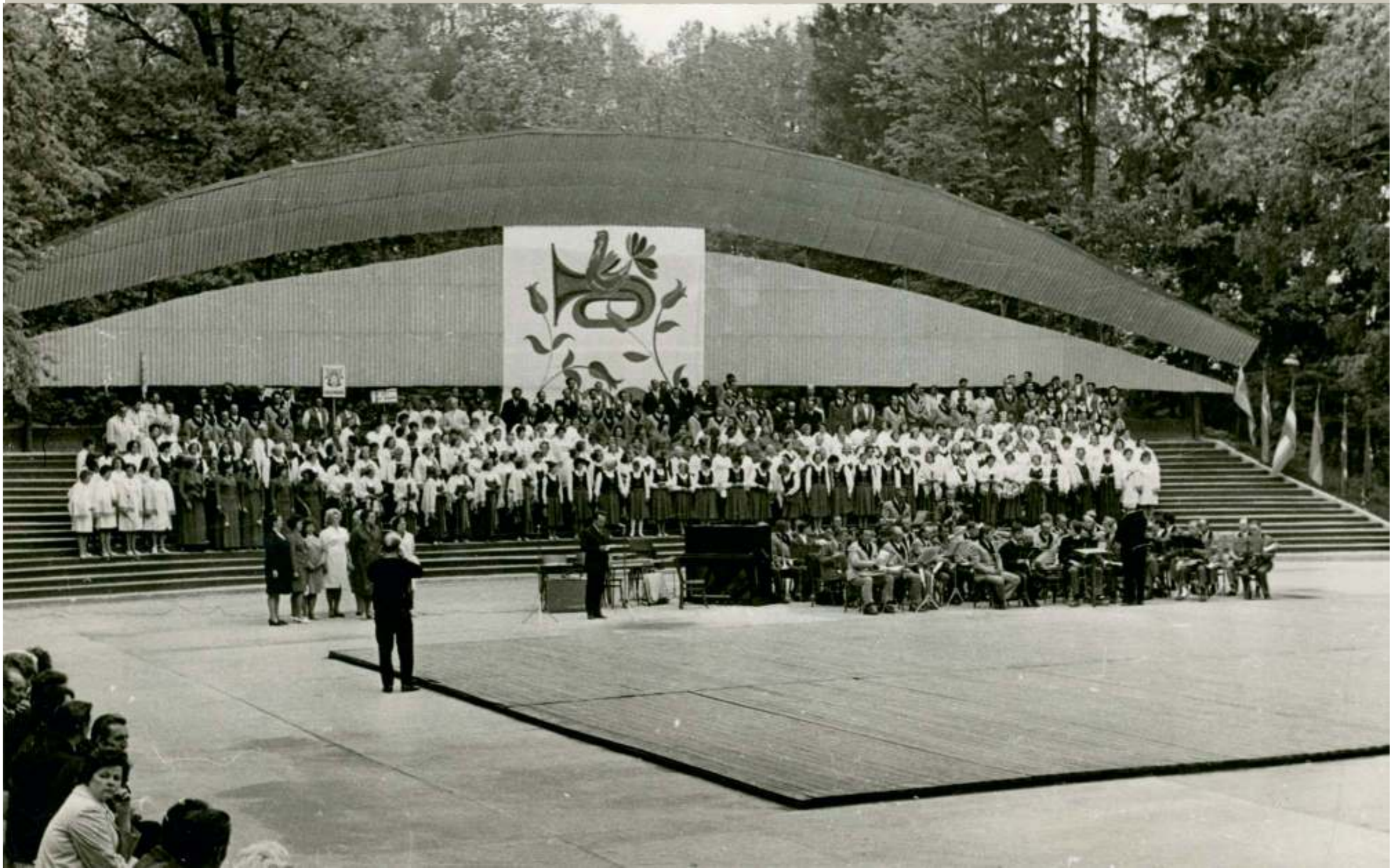
1972. gads. Nesen – pirms pāris vasarām – uzceltā estrāde