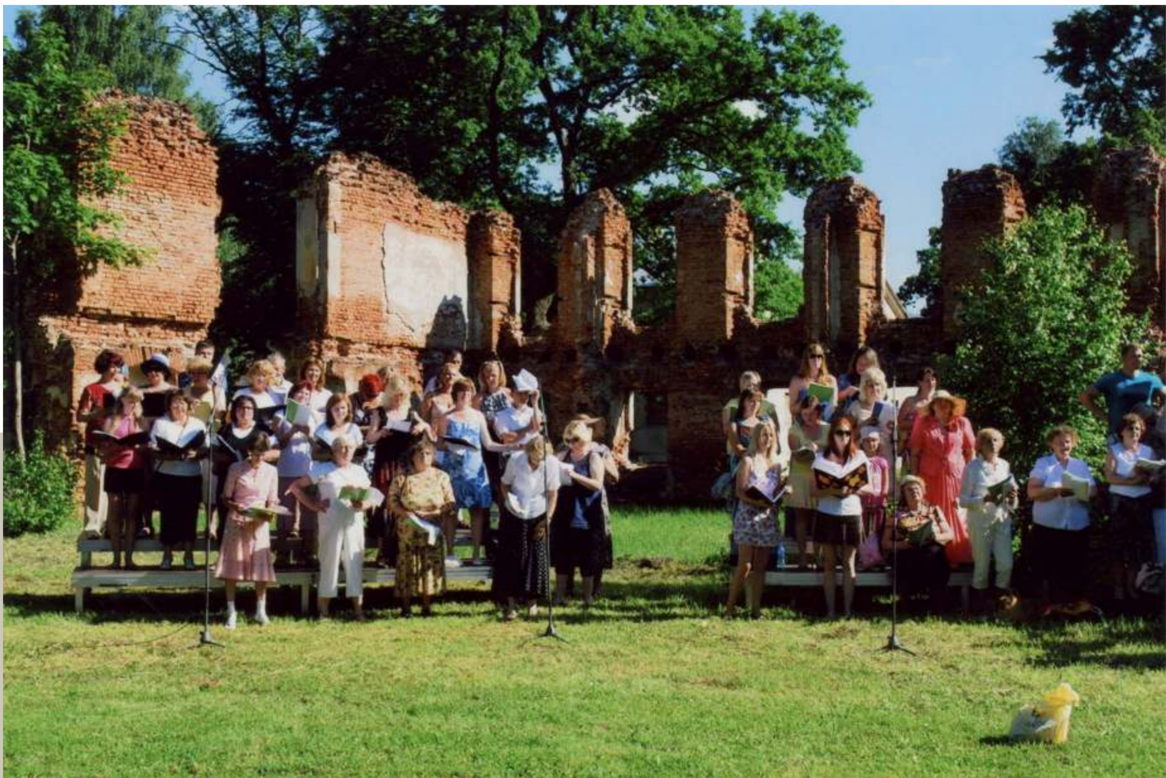
Jelgavas novada svētku koris mēģinājumā 2013. gadā