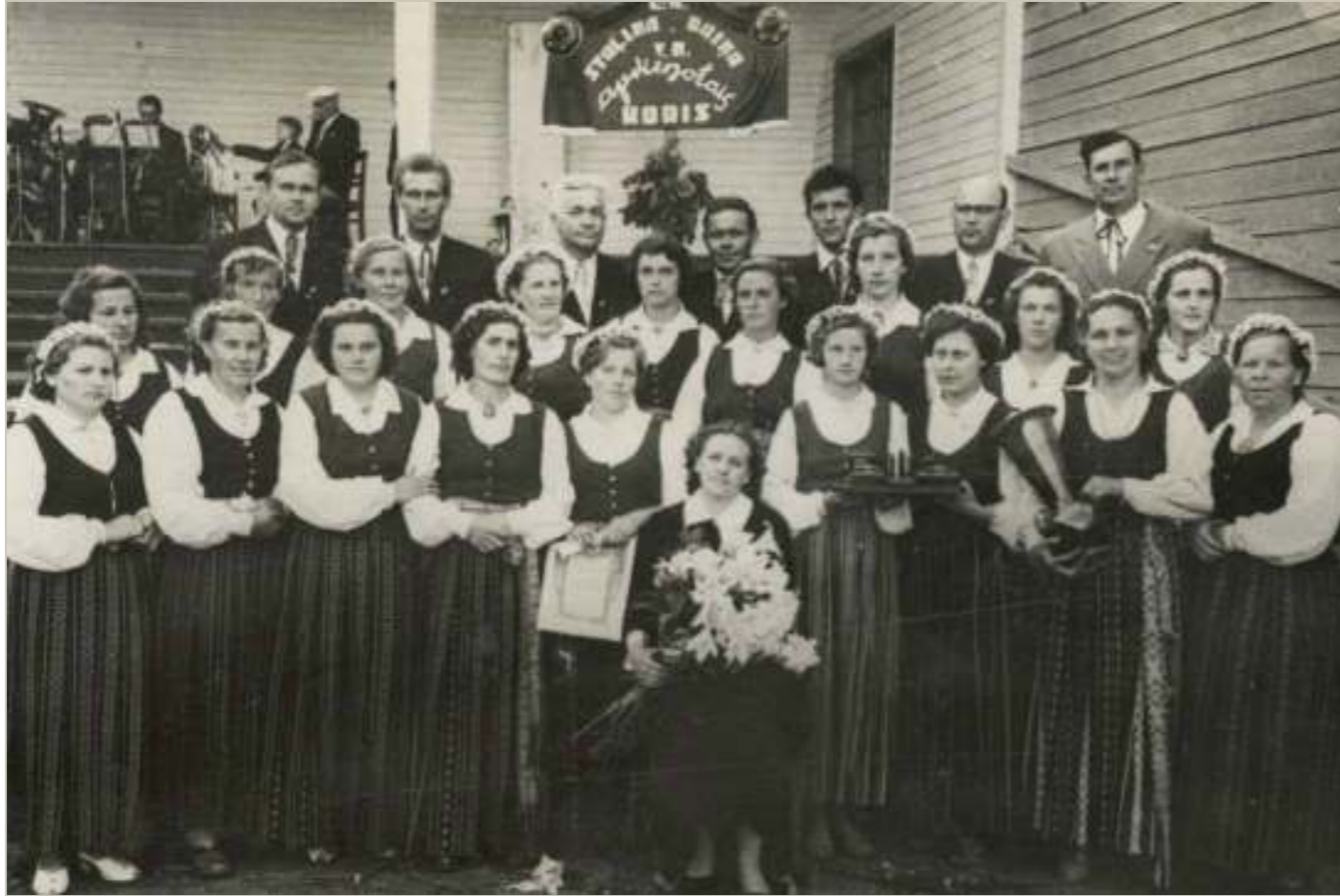
Godalgotais Jaunsvirlaukas koris ar savu diriģenti

Svētku laikā Elejas estrādes apmeklētāji varēja arī papriecāties par skaisto parku un tā apkaimē esošajām sendienu atblāzmām, pat ja skaistā Elejas pils jau stāvēja drupās. Attēlā – Dzirnieku puses koris pie sfinksas skulptūras atliekām parka pievārtē esošajos Parka kapos 1960. gada vasarā