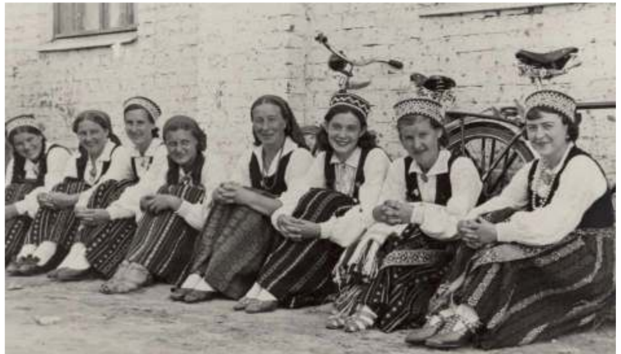
Zaļenieku kora soprāni svētkos Elejā 1939. gadā