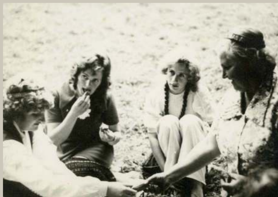
Protams, svētku laikā nav izpalikusi arī pieklājīga uzdzīve jeb sadraudzība. Lūk, Lielplatones koristi atpūtas brīdī 1973. gada svētku laikā Elejā