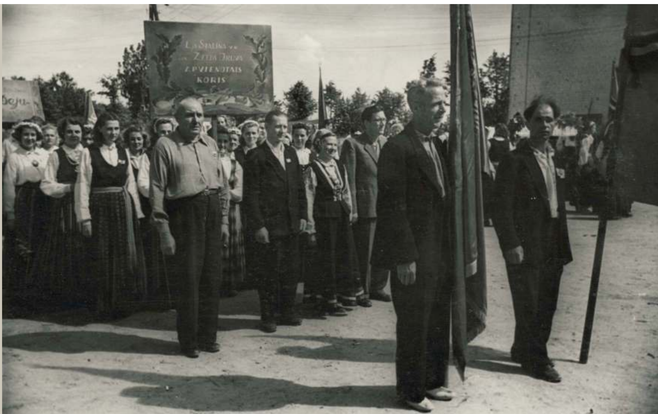
Dziesmusvētku koncertdaļu arī padomju laikā allaž ievadīja gājiens. Domājams, 1954. gada foto

20. gs. 50. gadu vidū tradicionāli kļuva dažādi festivāli Elejas parka estrādē – jaunatnes svētki, dziesmu un deju svētki vasarā. Šajos festivālos līdzās pieaugušajiem piedalījās arī skolēni, kuri blakus lielajiem gan bija krietnā mazākumā.