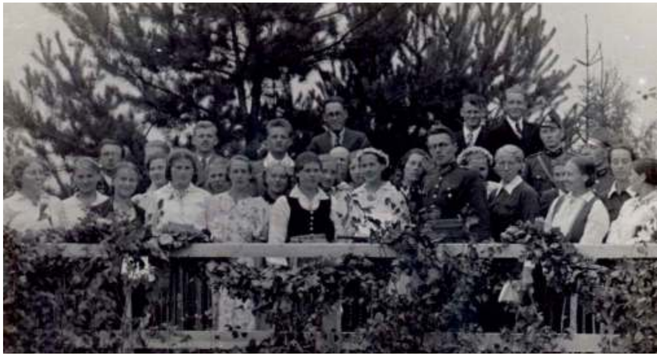
Ūziņu koristi Elejas dziesmusvētkos 1939. gadā