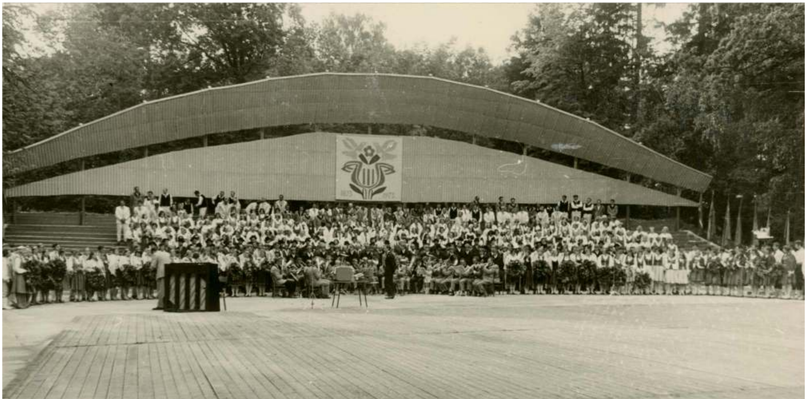
Koncerta fināls sapulcējis arī deļotājus