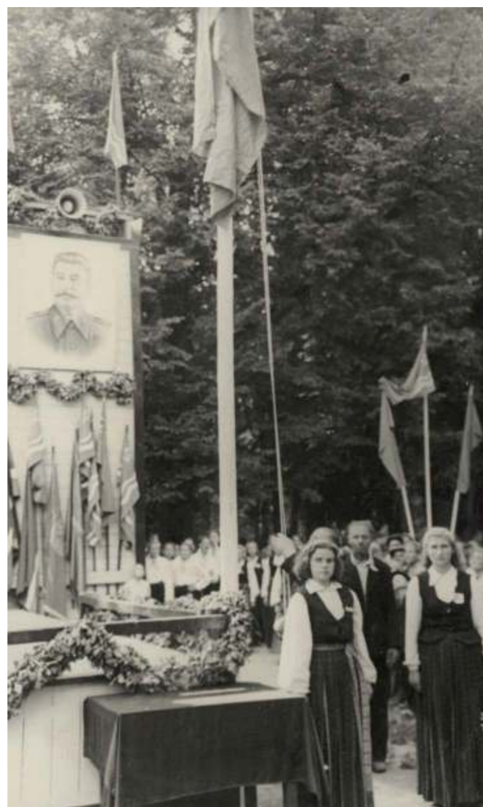
50. gadu dziesmusvētkos daudz kas atgādināja politisku demonstrāciju. Tāds bija laiks!