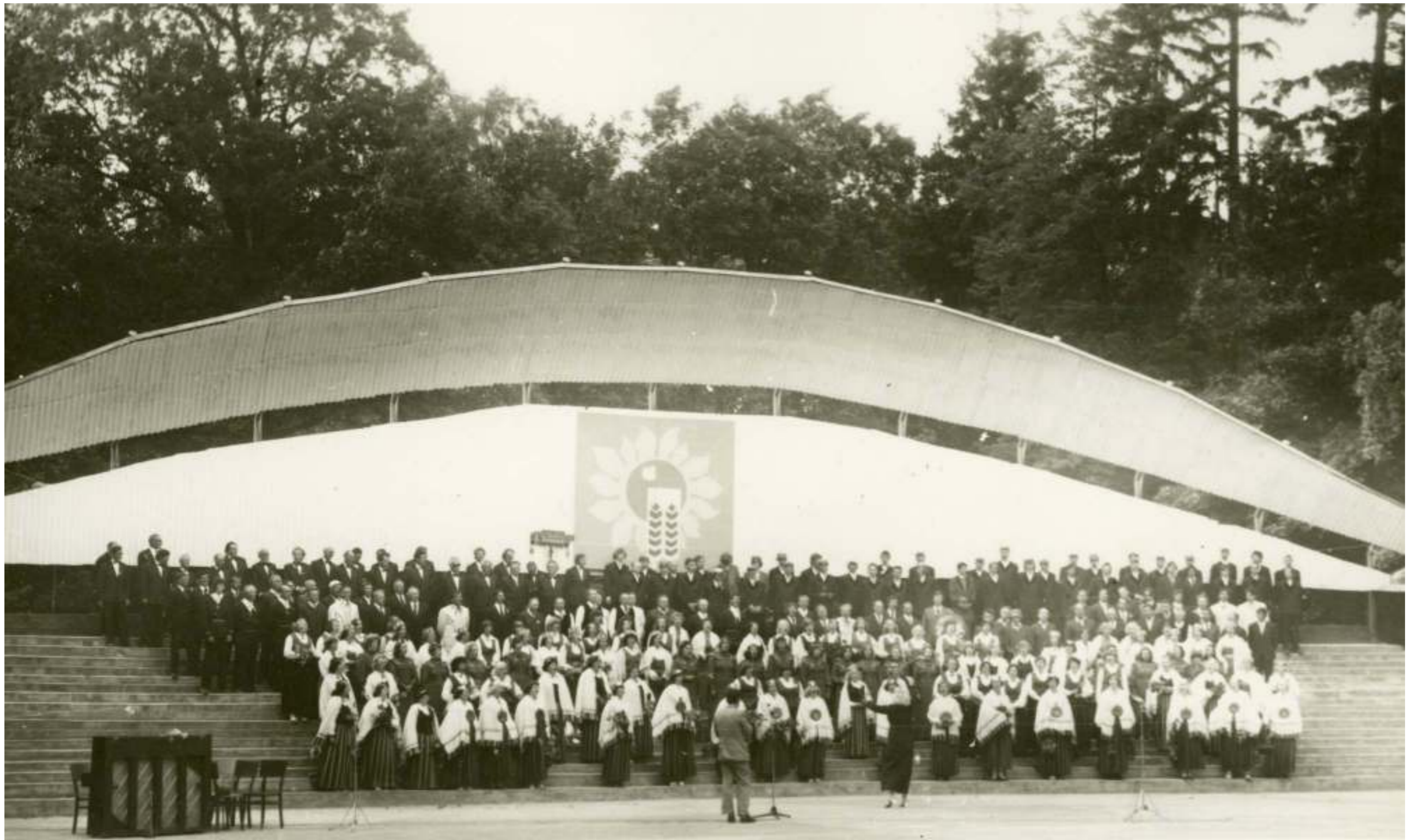
Ik reizi estrādes centru rotāja cita emblēma, kas parasti bijusi redzama arī svētku reklāmas un piemiņas materiālos. Bildē joprojām 1979. gads