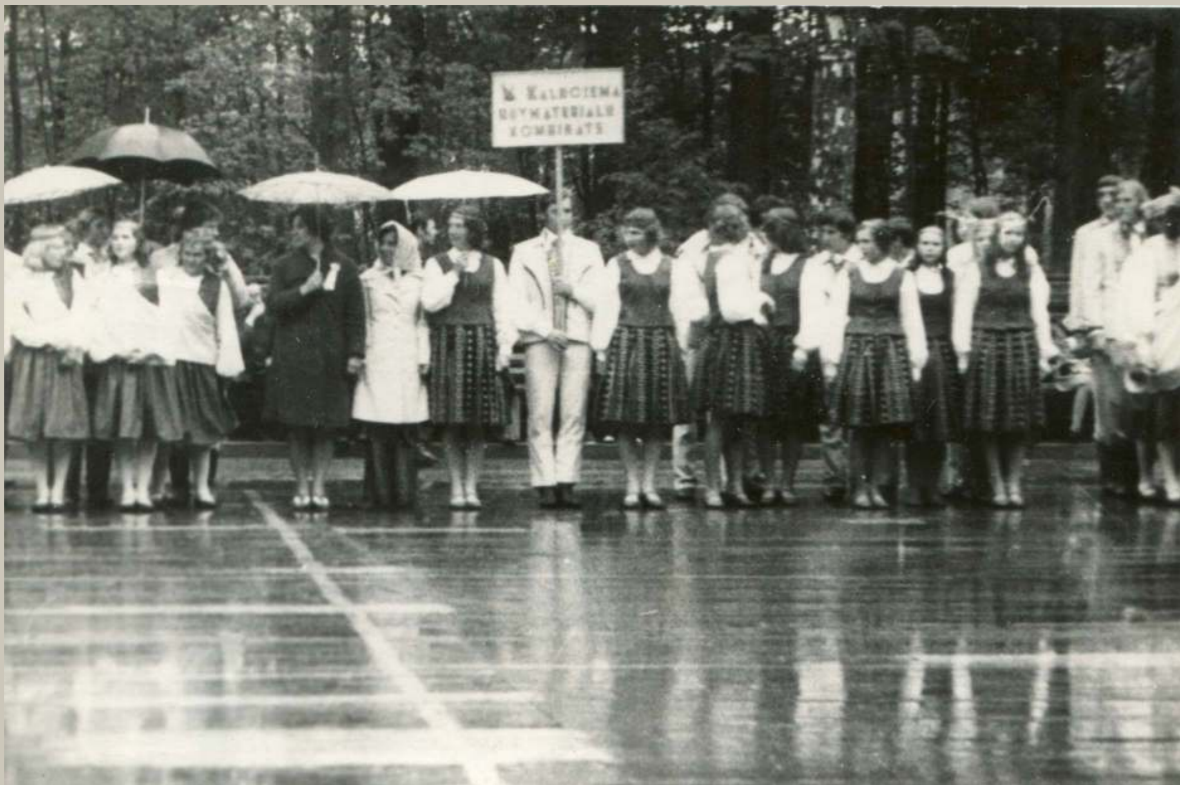
Dažkārt gan svētkus nācies baudīt arī ne tai saulainākajā laikā... 20. gs. 70. gadu foto