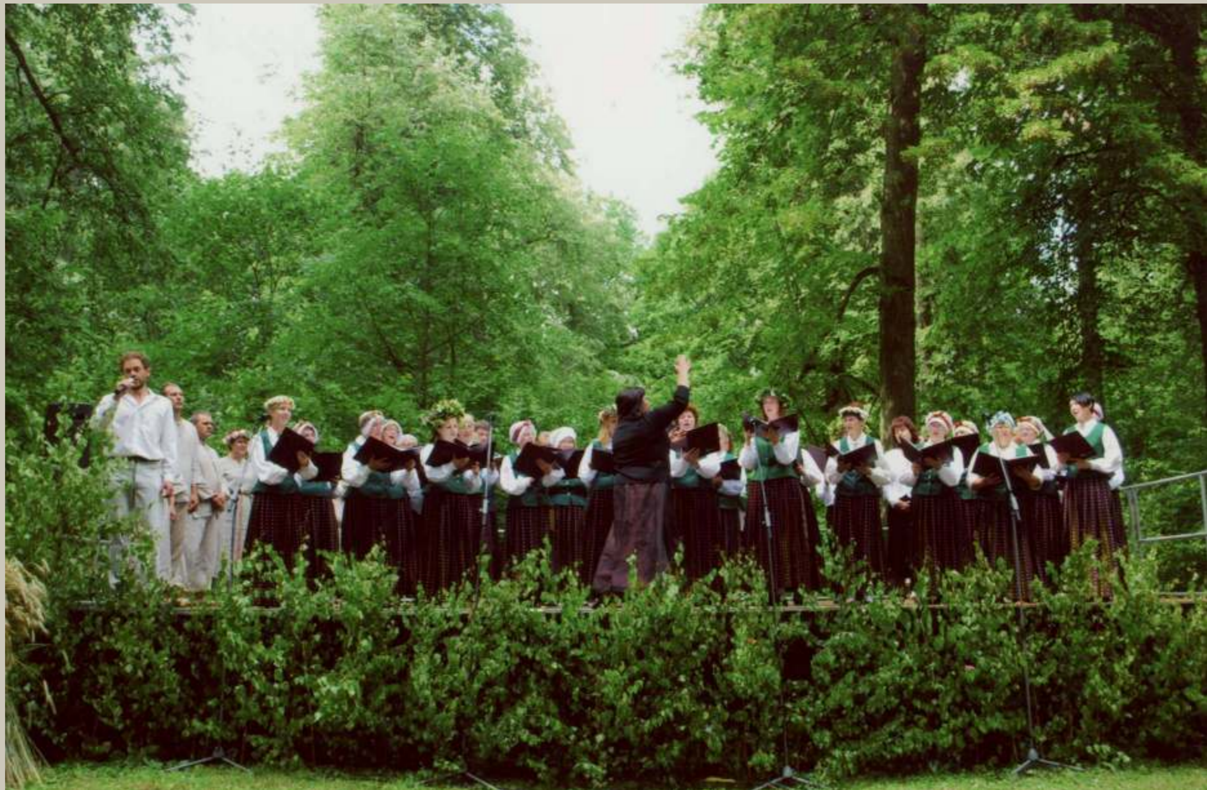
Jelgavas novada svētkos 2011. gadā