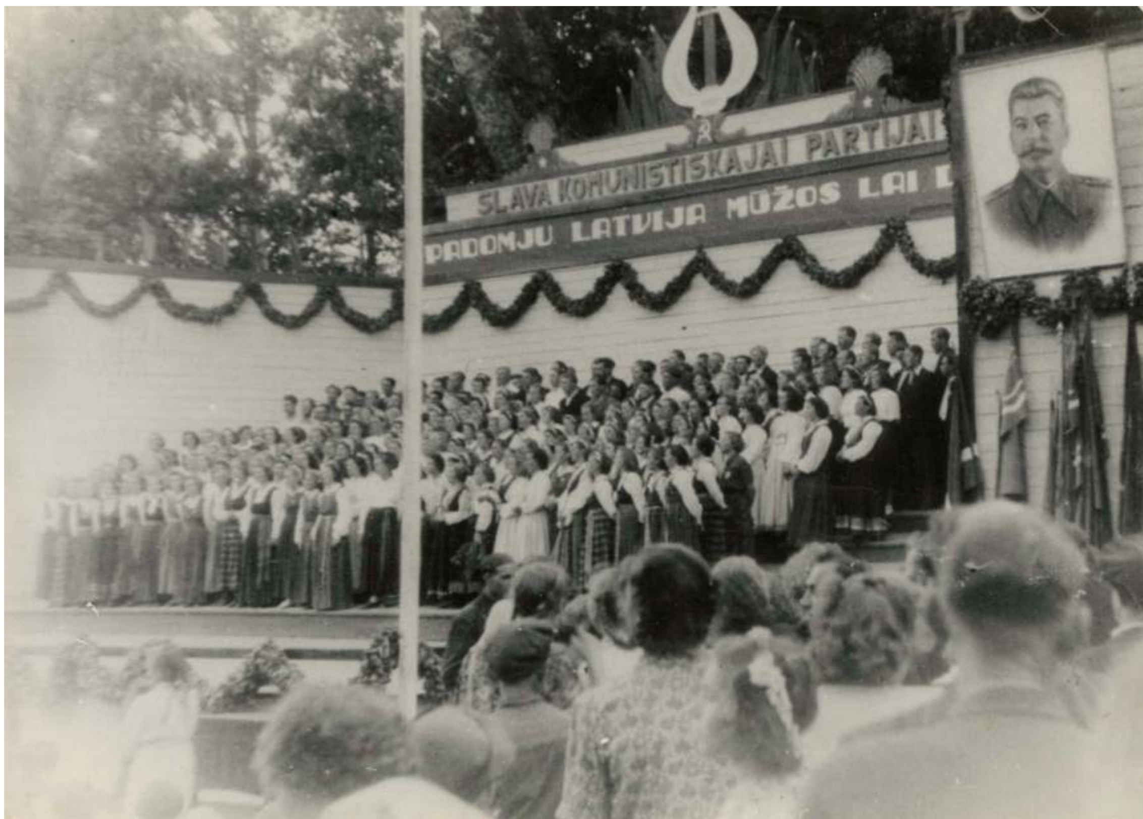
1955. gads. Bez Padomju Savienības vadoņa un “visu tautu tēva” Staļina ģīmetnes – nekādi...