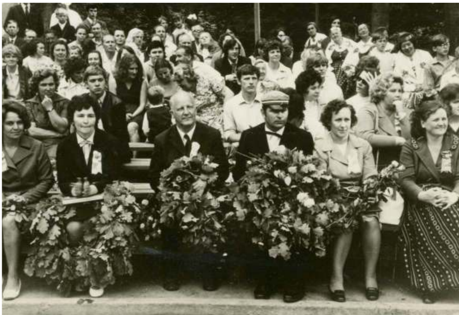
Visvairāk goda tika amatiermākslas kopu vadītājiem un virsvadītājiem