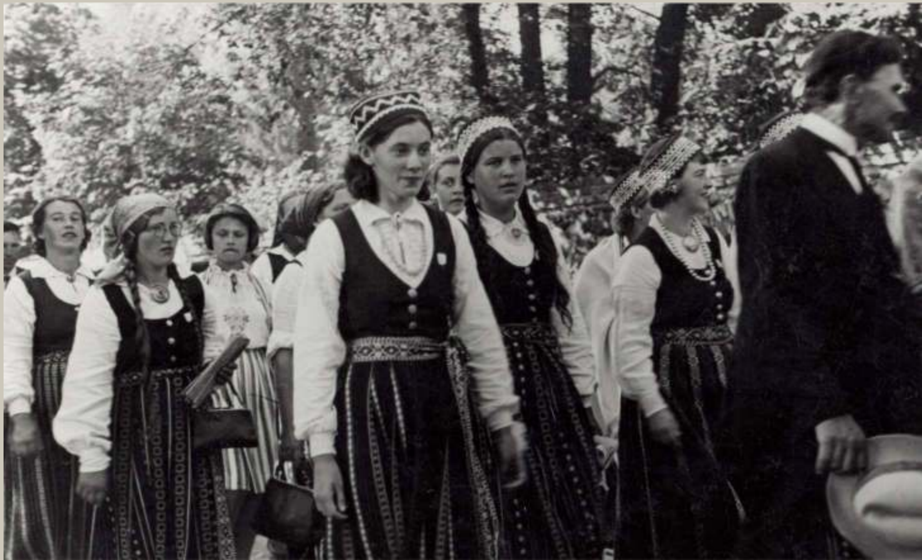
Koru gājiens uz muižas parku Elejas novada Otrie dziesmu svētkos 1939. gada augustā. Redzami kori no Jēkabniekiem un Zaļeniekiem